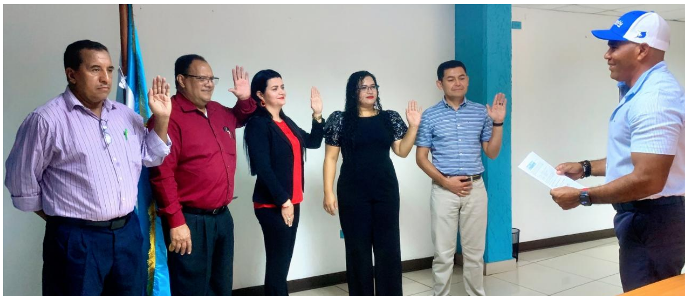
El Comisionado Presidente de CONDEPOR juramentó al COCOIN 2023

Comisión Nacional de Deportes Educación Física y Recreación